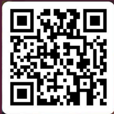
Formulaire Théâtre le Dôme